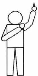
Anchorman's grip Ankermans greep

We gaan hier even niet in op wat er op de rug gebeurt, maar hebben aandacht aan de houding van de handen. Waar bij de gewone touwtrekker de "ordinary grip" nog ruimte laat voor interpretatie, is dat bij het anker veel minder het geval. Hier is duidelijk omschreven dat de beide armen naar voren gestrekt moeten zijn. In dit geval zien we dat de rechterarm duidelijk niet gestrekt voorwaarts gericht is. De rechterarm wordt hier gebruikt